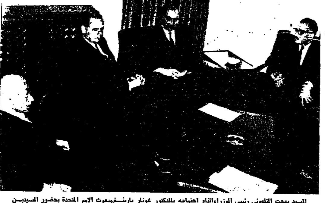
السيد بهجت الشاهي رئيس الوزراء اجتمع بالكتور غونار بارينغ مع وفد الامم المتحدة بحضور السيد احمد طوقان نائب رئيس الوزراء وعبد القم الرفاعي وزير الدولة للشؤون الخارجية

رد الجيش عدونا اسرائيلياً عمان - ادلى ناطق عسكري اردني بما يلي : في الساعة الثانية عشرة واربعين دقيقة من ظهر اليوم امس فتح العدو القار من مدافع عيار ١٠٦ ملم وريشات متوسطة على مواضع البقية على الصفحة الرابعة عمود ١